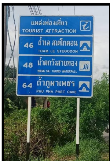
ป้ายแนะนำแหล่งท่องเที่ยว