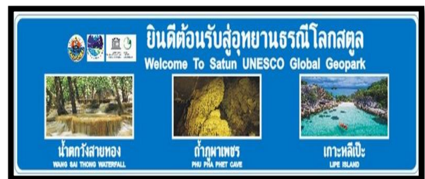
จุดติดตั้ง ทางหลวงหมายเลข ๔๐๖ (แยกทุ่งตำเสา) ที่ กม.๖๕+๐๕๐ ด้านซ้ายทาง