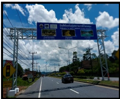
ป้าย OVERHEAD คร่อมถนน